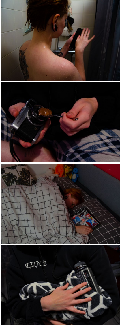
Prototype 2: 4 afbeeldingen die een relatie tussen mens en object weerspiegelen.