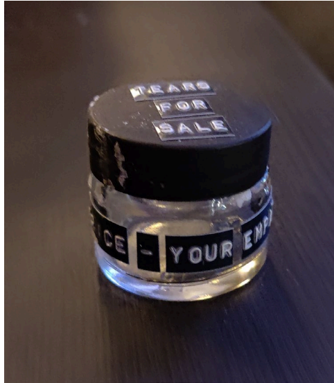
Prototype 1: Een potje met tranen met empathie als betaalmiddel in een dystopisch toekomstbeeld.